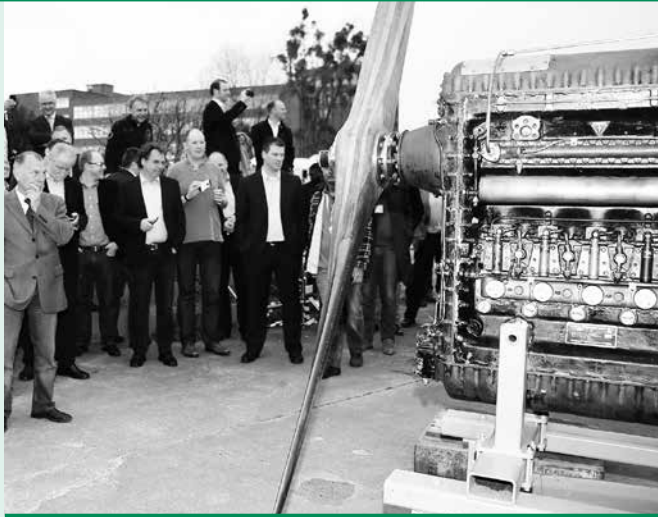
Start des Junkers-Flugmotors Jumo 205C.