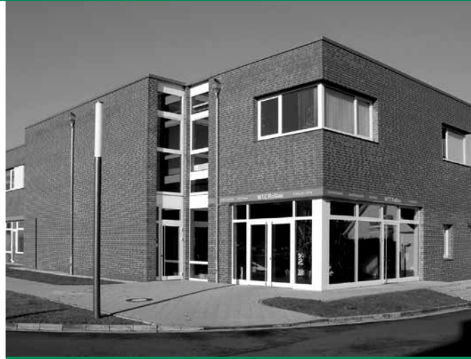
WTZ Roßlau gGmbH