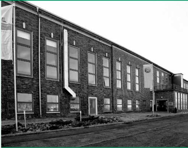
Veranstaltungszentrum Golf-Park Dessau in Dessau-Roßlau