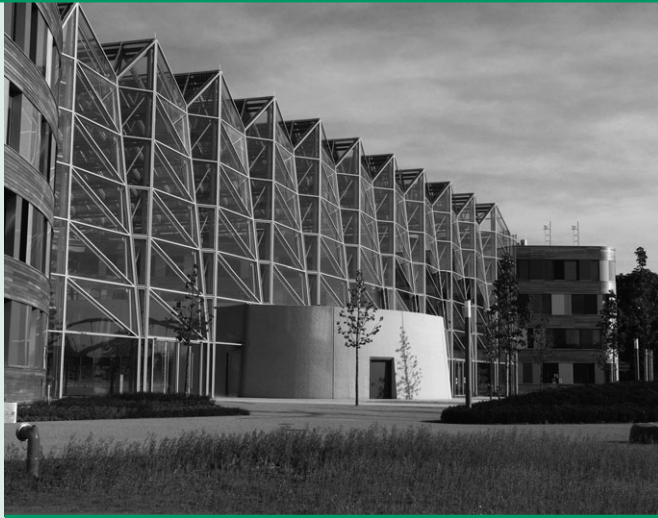
Umweltbundesamt | Konferenzgebäude in Dessau-Roßlau