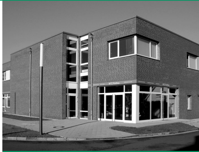
WTZ Roßlau gGmbH